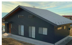
将来を見据えた家