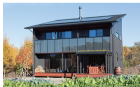
おしゃれな自然素材の家