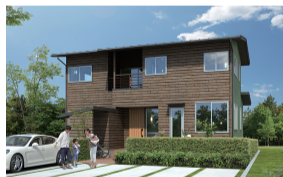
光熱費半分 エアコン1台で冷暖房