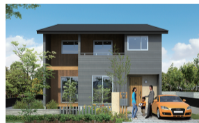
素敵な奥様のための暮らしやすい家