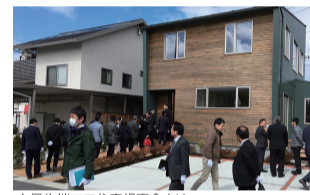
▲最先端エコ住宅視察会より